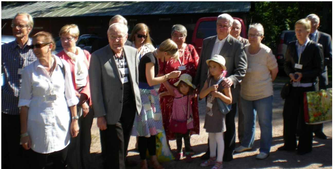
Kartanoravintola Wanha-Emäntä Karjalohja 25.8.2013, kartanon pihapiirissä tämän päivän töröläisiä.